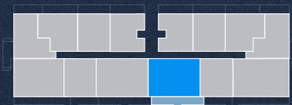
PISO 4 4 th FLOOR

ÁREA TOTAL / TOTAL AREA (INTERIOR + EXTERIOR): 92.03 m 2